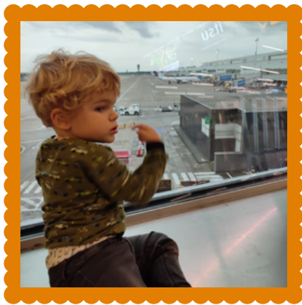
Vliegtuigen kijken op luchthaven Addis Abeba