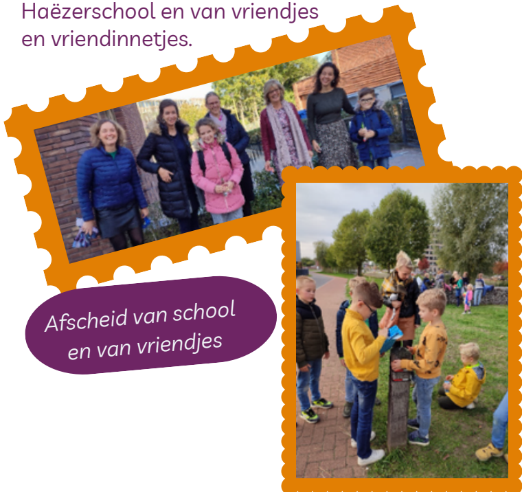
Afscheid van school en van vriendjes

We zijn blij dat we alles in Nederland goed af konden ronden de afgelopen tijd. De kinderen hebben een mooi afscheid gehad op de Eben Haëzerschool en van vriendjes en vriendinnetjes.