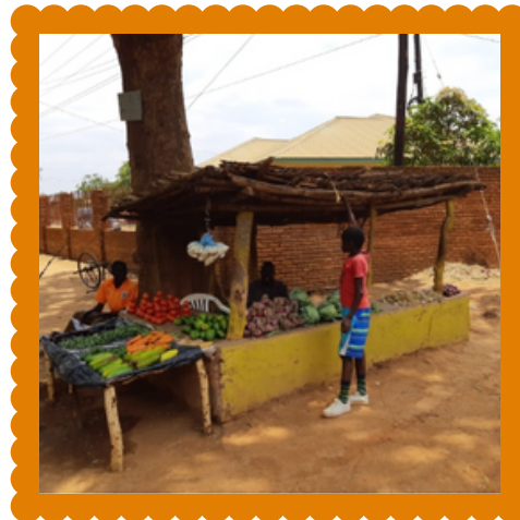
Stalletje waar we regelmatig onze groenten kopen