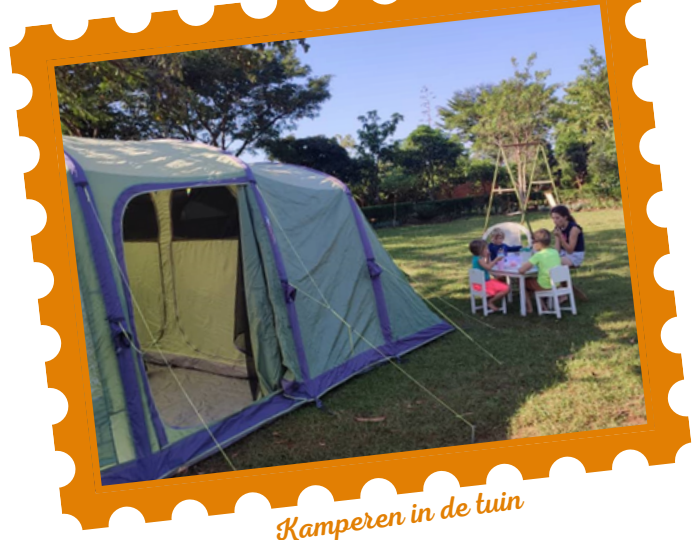
Kamperen in de tuin