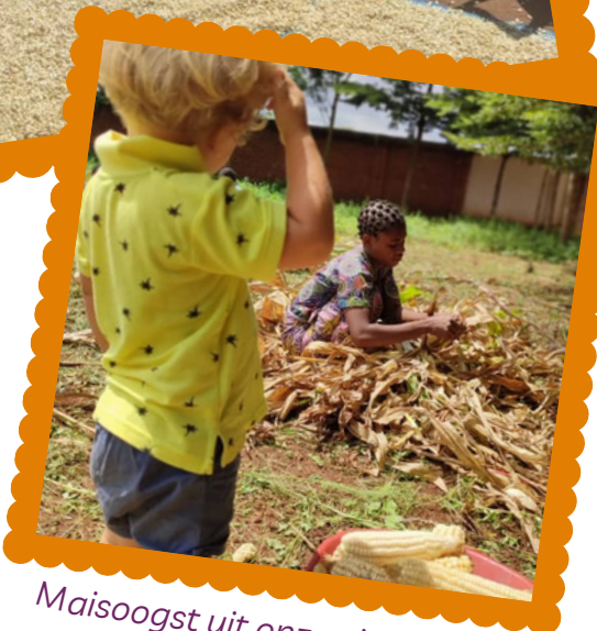
Maisoogst uit onze eigen tuin