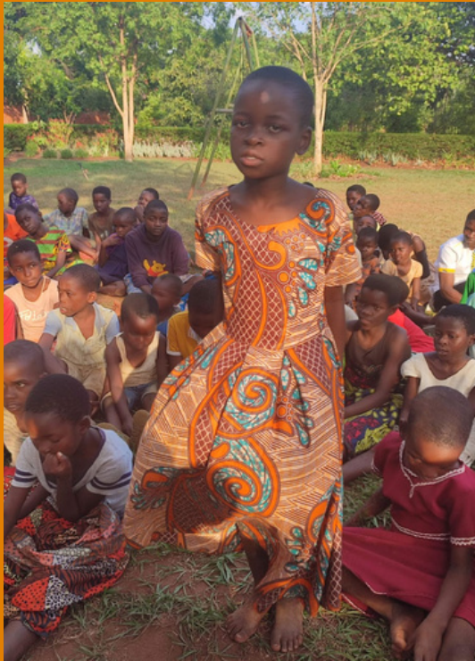
De net geleerde Bijbeltekst opzeggen