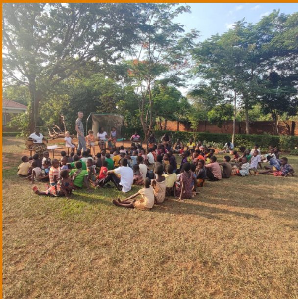
Luisteren naar het Bijbelverhaal