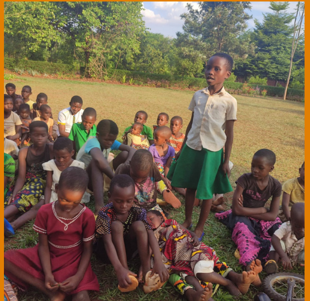
Ook dit meisje zegt haar zojuist geleerde Bijbeltekst op

Tegelijkertijd realiseren we ons hoe bevoorrecht we zijn dat onze wortels in Nederland liggen, waardoor we genoeg financiële middelen hebben om niet met honger naar bed te hoeven gaan. We zijn daarom blij dat op Talandira Harvest Centre het voedselprogramma weer begonnen is. Hierdoor hebben de kinderen in elk geval één keer per dag genoeg te eten. Er wordt hier en daar al wel weer op het land gewerkt, maar er kan pas op z'n vroegst over een half jaar geoogst worden.