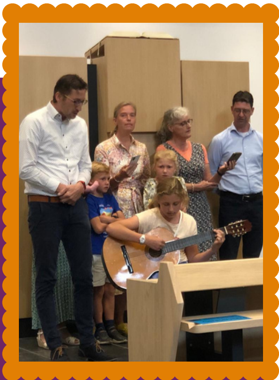
kinderzanggroep uit Utrecht

Het was een afwisselend muzikaal programma. De collecte bracht het mooie bedrag van 1650 euro op ten bate van het werk in Malawi!