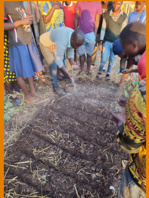
zand strooien op de zaaadjes

Overigens zie je hier al dat de pijlers vaak in elkaar overlopen. In dit geval de tienerclub: die is primair bedoeld om het Evangelie te verspreiden, maar in