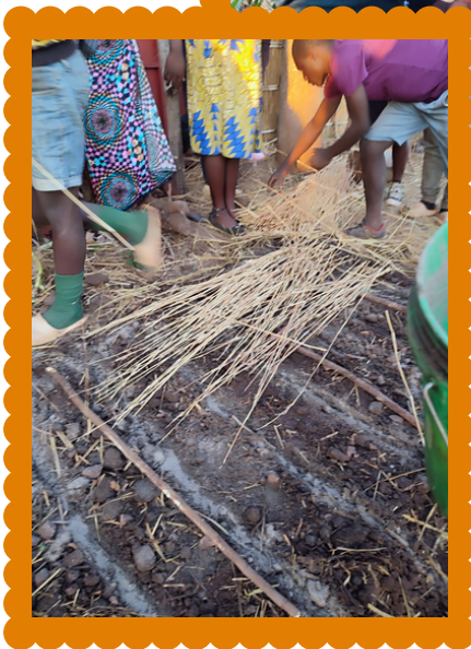
de grond bedekken

dit geval werd er ook tijd ingeruimd voor een zaaitraining. Een ander voorbeeld is het sponsorprogramma. Hieraan nemen zo'n vijftig weeskinderen deel. Ze worden vaak door een oom of tante, of opa of oma verzorgd. Voor de verzorgers leidt het overlijden van hun broer/zus of zoon/dochter dus niet alleen tot rouw om dat verlies, maar ook tot een extra mondje om te voeden. Daarom biedt Stéphanos een training aan deze verzorgers aan, om hen te helpen hun oogst te verbeteren. Ook hier lopen de verschillende pijlers van ons werk dus in elkaar over. Wat betreft de landbouw hebben we het oogstseizoen alweer gehad. In midden-Malawi is de oogst dit jaar goed, maar in het noorden en