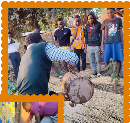
water gieten over de bedekte grond