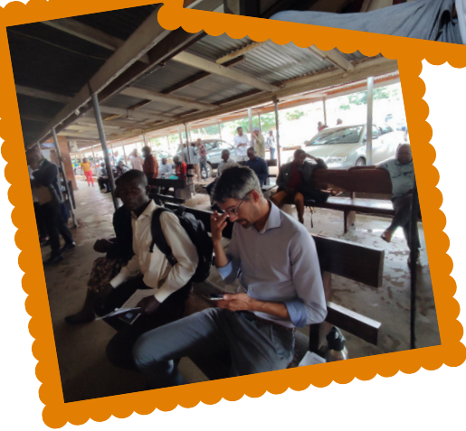
Vingerafdrukken afnemen voor het rijbewijs Wachten bij het Bureau Road Traffic