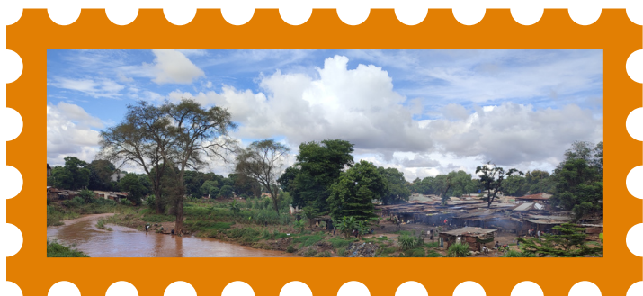
Malawi kleurt groen

Het koelere weer geeft ons meer energie. Zodra de regentijd start, gaat iedereen het land op om te zaaien. Er wordt hard gewerkt door jong en oud. Iedereen is ervan doordrongen dat dit een belangrijke tijd is. Want als er niet gezaaid wordt, en er geen regen valt, zal er ook geen oogst zijn. Ondertussen zien we dat gewassen goed groeien en heel Malawi kleurt prachtig groen. Ook wij hebben met behulp van de tuinmannen maïs geplant, zodat er straks genoeg lunch is voor de mensen die ons in en rond ons huis helpen. We hopen en bidden dat er een goede oogst komt dit jaar.